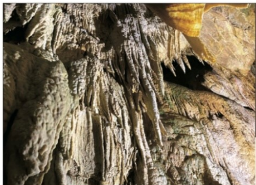
鍾乳石が圧倒的な天上界

大滝鍾乳洞は古生代の石灰岩層にできた断層が、地下水によって削られ生成されました。全長約2kmのうち700mを観光コースとして公開しています。洞内にはつらら石や石筍、石華等多彩な鍾乳石が鑑賞できます。鍾乳洞内は年間を通じて15℃と安定しています。最深部には落差約30mの地底の大滝があり、当鍾乳洞のシンボルとなっています。