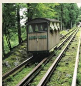
入口まではケーブルカーで