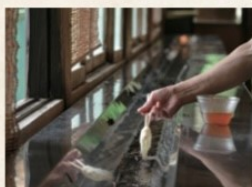
流しそうめん (季節営業)

鍾乳洞の湧水が手延べそうめんをきりりと引き締めます。麺は食べ放題、汁のお替りOK。立ち食いでお召し上がりください。